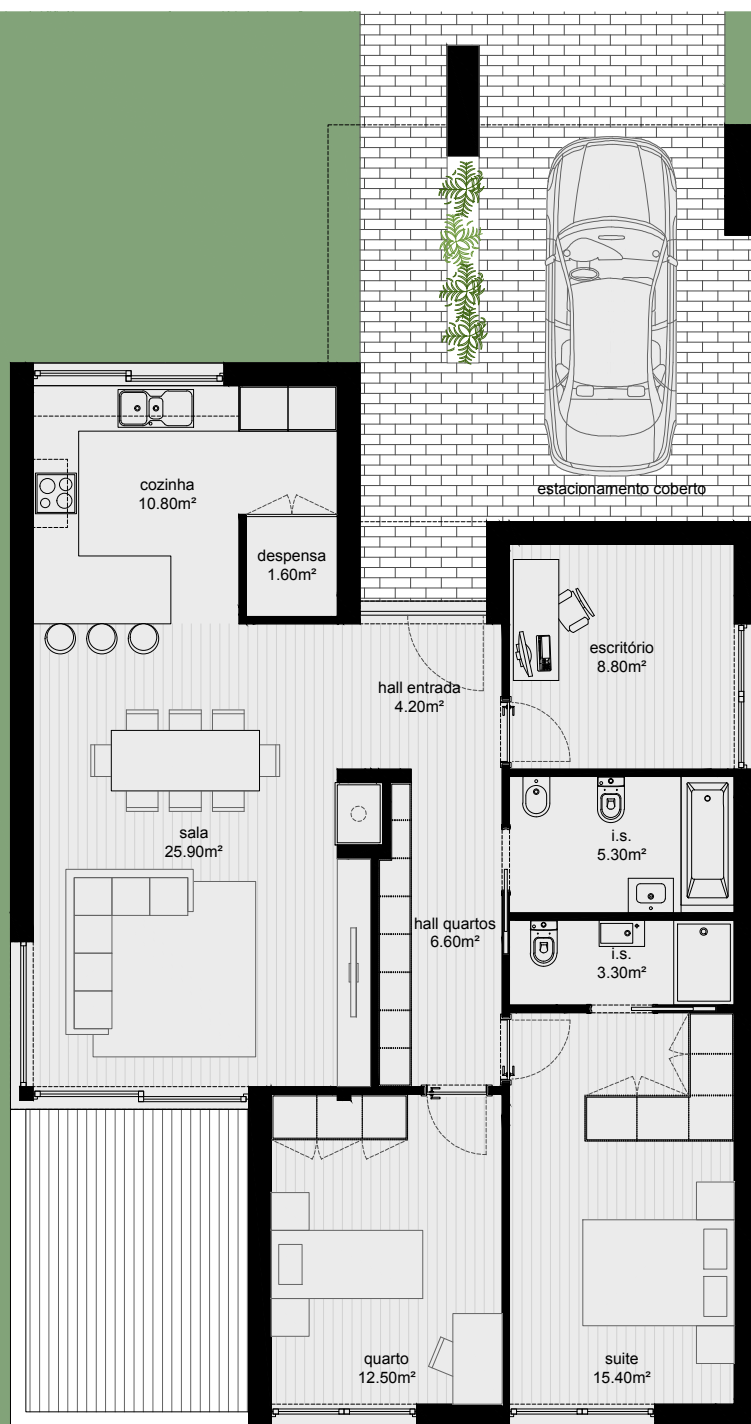
PLANTA DE PISO (1:100)